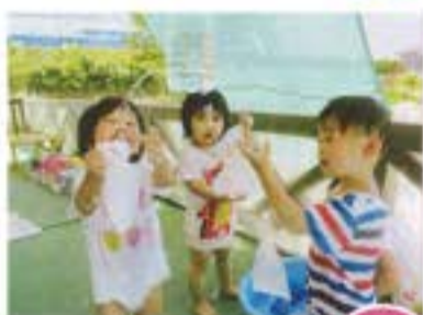
「わあ〜」「あれれ…」 冷たいね。