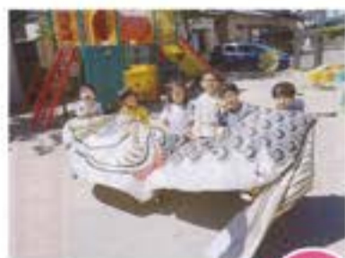
こいのぼりと 大きさをくらべたよ