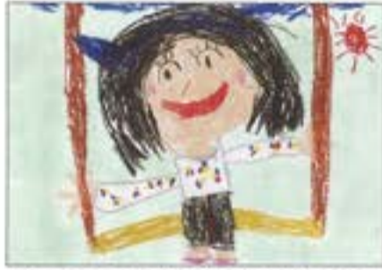
「きっこりーたうんでぶらんこにのったよ」 山五十嵐こども園 5歳児 あらい えみ