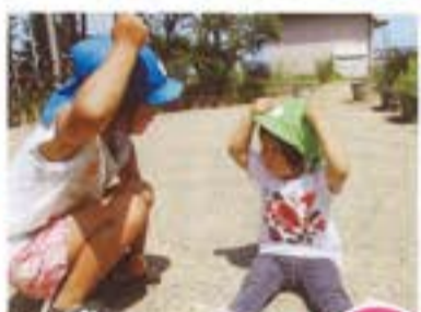
ドキンちゃんか じょうずでしょ?