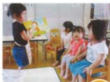
「今日はわたしが せんせいよ!」