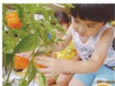
ドキドキの初収穫!!