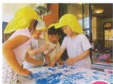
「どろどろ どろんこえのく おためし中!!」