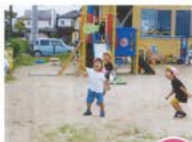
トンボまてー! 捕まえるぞ!