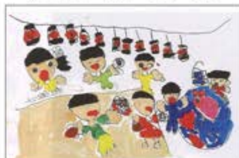
「なつまつり きんぎょとれるかな？」 新金沢保育園 5歳児 むとう ゆめ