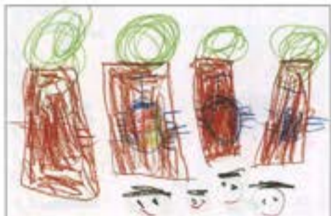
「にじいろカブトムシとクワガタ」 中山保育園 3歳児 ありさわ きょうこ