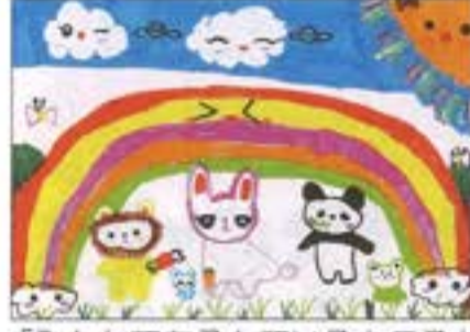
「みんなであそんでいるところ」 寺尾幼稚園 5歳児 なかの すい