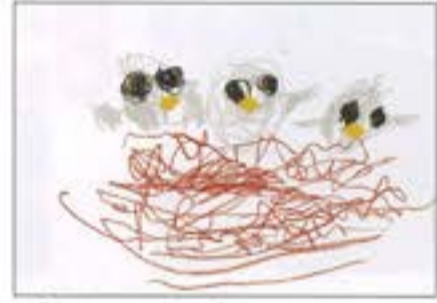
「かわいいつばめのひなたち」 吉田乳児保育園 2歳児 ほしの るな