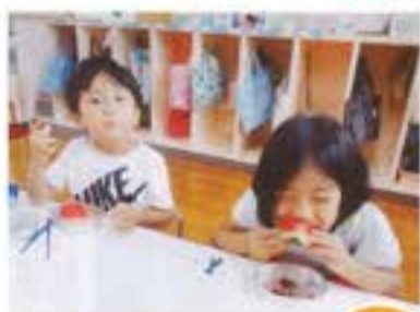
「夏はやっぱり これだよね!」