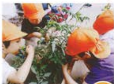
どんなにおいが するかなあ?