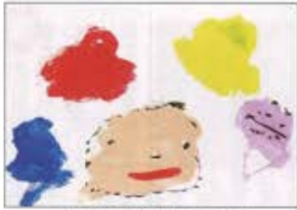
「ママと恐竜のたまご」 下越病院たんぽぽ保育園 2歳児 がやま はる