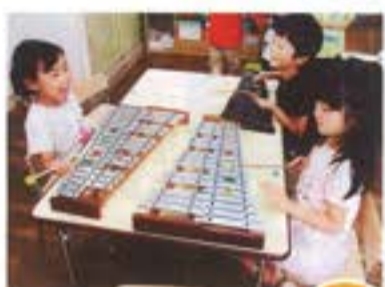
一緒に鳴らしたら、 きれいな音になったね。