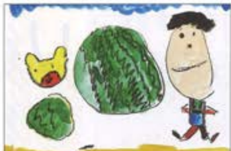
「ずいかわりたいかいをしたよ」 両川保育園 5歳児 はだ いつき