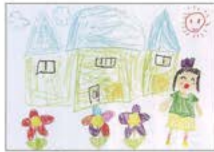
「わたしのうち」 みなと福祉保育園 5歳児 おおの ことは