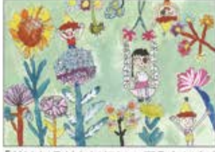
「おはなのせかいにいてみたいな」 あいらすこども園 5歳児 しろの つむぎ