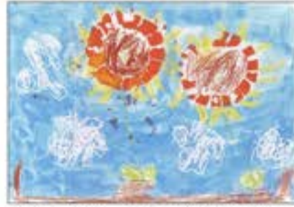
「おっかい ひまわりがさいた」 松の美こども園 4歳児 たけなが ゆずは