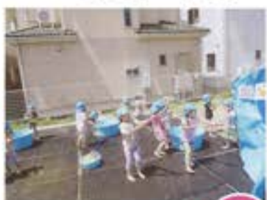
的をねらって〜 ビュ〜!