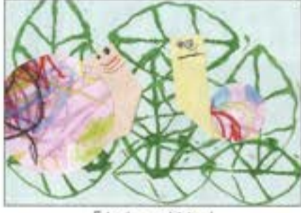
「かたつむり」 あそびの森せし保育園 2歳児 きりゅう あきと