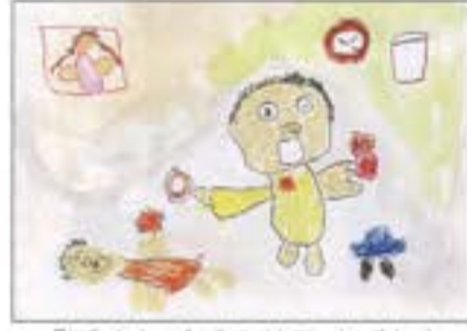
「ぼくとパパのおるすばん」 るんびいこども園 5歳児 かとう えいせ