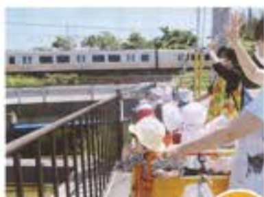
電車、ばいばあ〜い。 気をつけて行ってきてね〜。