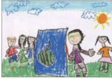
「たのしかったすいかわり」 東小針認定こども園 5歳児 やべ まどか