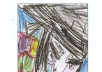
「大好きな大綱「役者組」」 あかねこども園 5歳児 さいとう りくと