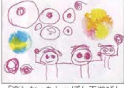
「楽しかったしゃぼん玉遊び」 風の子保育園 3歳児 ふじた なほ