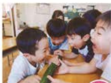
おぼけきゅうり 食べちゃうぞー!