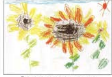
「ひまわりがさいたよ」 小針/スデルこども園 5歳児 おいかわ そうた