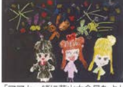
「ママと一緒に花火大会見たよ」 ぬくみこども園 5歳児 わたなべ ひろね