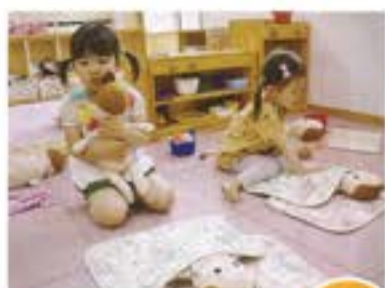
赤ちゃんトントンして あげますよ〜