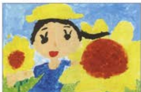
「たのしいな！ひまわりばたけにいったよ」 あじほ保育園 5歳児 たねむら ももこ