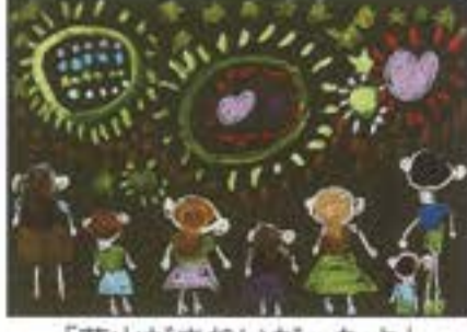
「花火がきれいだったよ」 かたひがし保育園 5歳児 さかい みのり